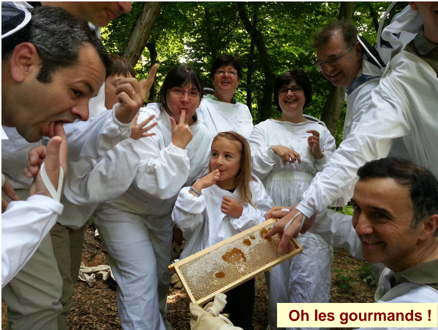
Oh les gourmands !