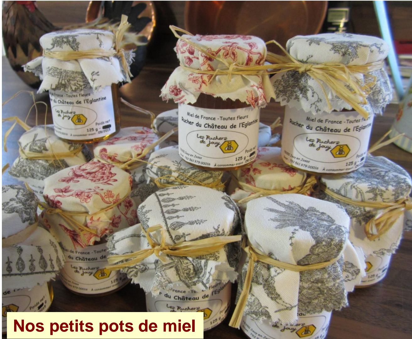
Nos petits pots de miel