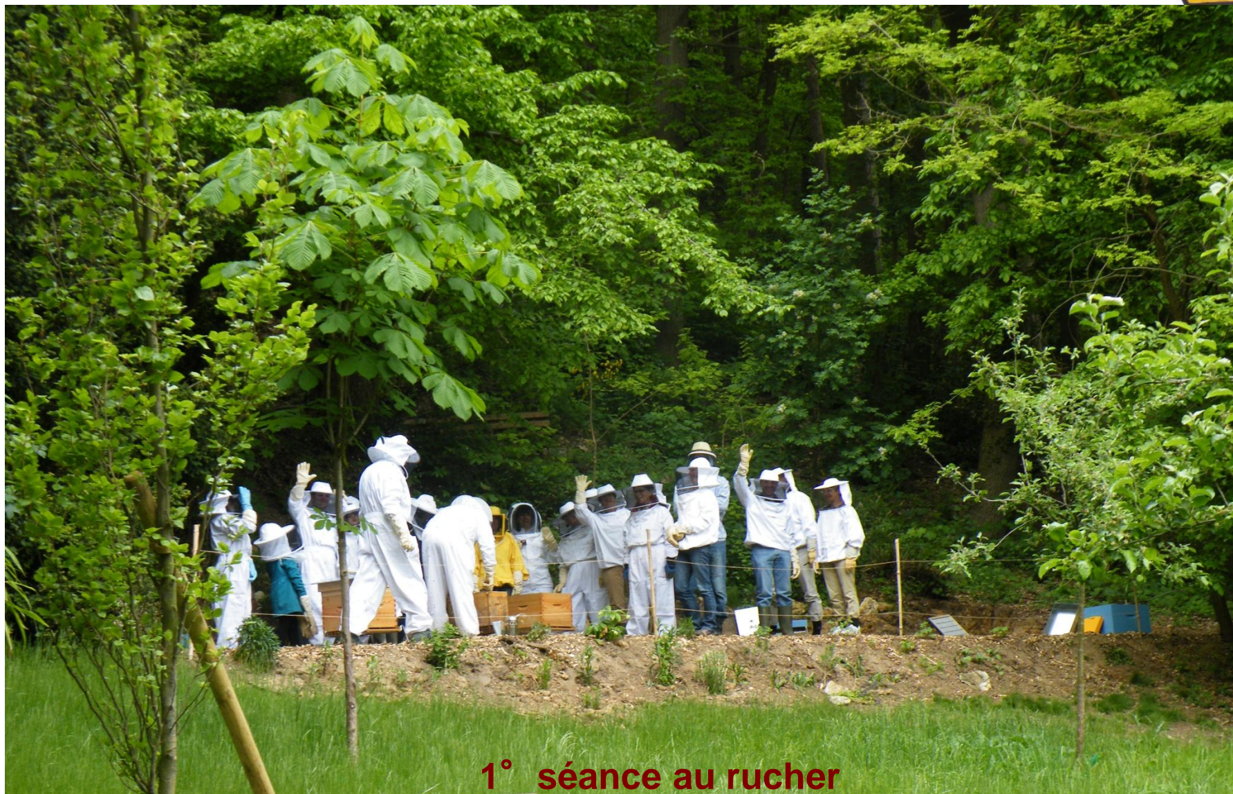
1° séance au rucher